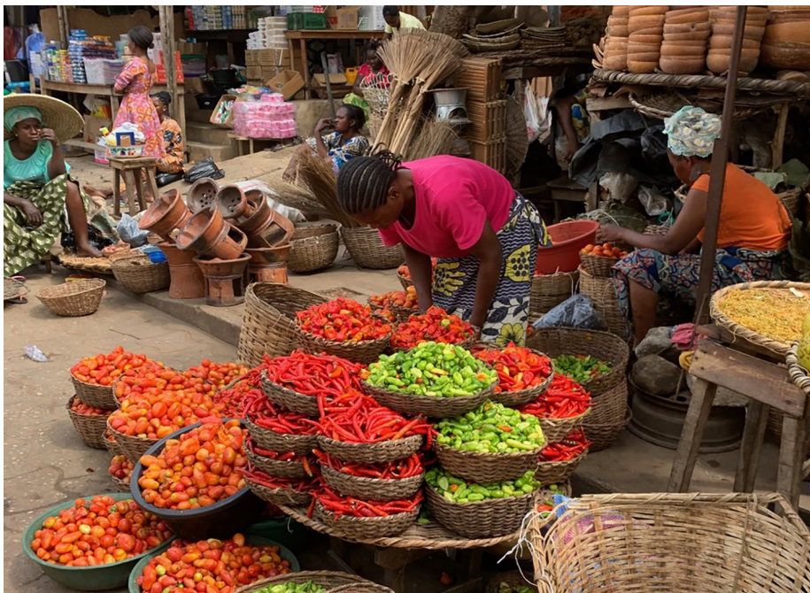
Le Centre de Récupération et d'Éducation Nutritionnelles (CREN) enseigne aux mamans des dénutris à utiliser les ressources alimentaires locales.

Un reçu fiscal vous sera envoyé par courrier. Merci !